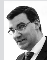
Karsten Bourwieg Bundesnetzagentur für Elektrizität, Gas, Telekommunikation, Post und Eisenbahnen